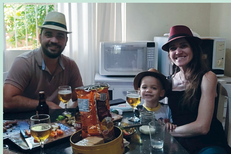
Em família sempre muito bom