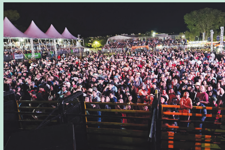
FESTA DO PEÃO DE CRUZMALTINA FOI SUCESSO TOTAL