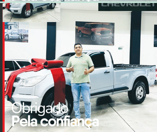
Obrigado Pela confiança