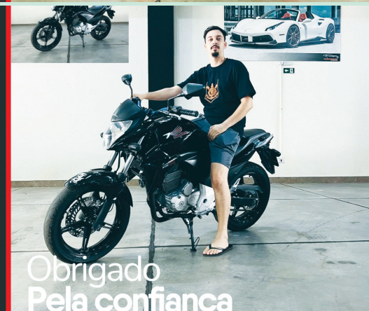
Obrigado Pela confiança