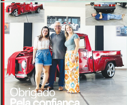
Obrigado Pela confiança