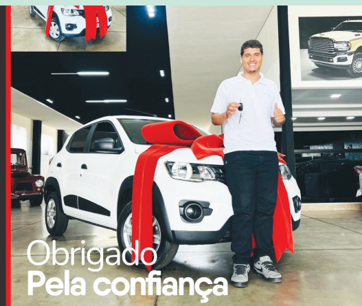
Obrigado Pela confiança