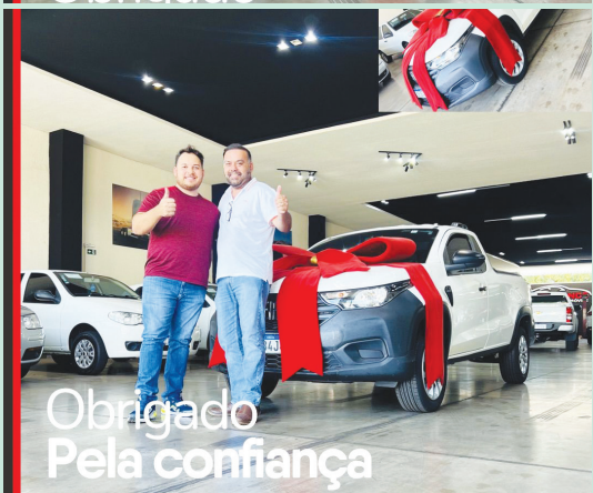
Obrigado Pela confiança