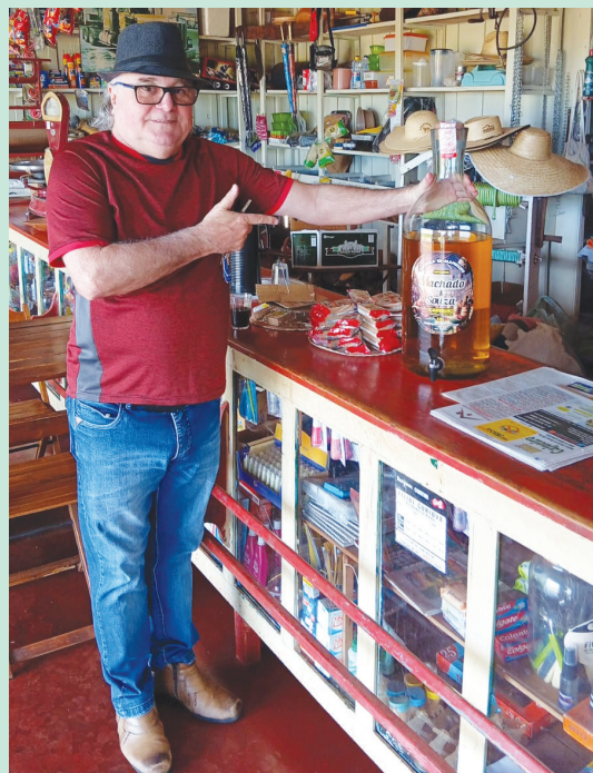
Cachaça da boa é no Bar da Nice em