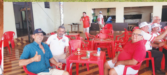
COL DOS ANOS 70, 80, 90 EM RIBEIRÃO SUCESSO TOTAL