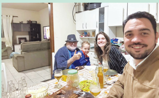
Sempre em família, muito bom