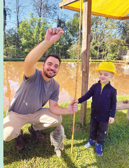
Familia Mantovani De Dio na pescaria